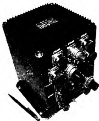
Рис.2 Многофункциональный программируемый контроллер

многофункциональном программируемом контроллере-МПК разработки НПП «Антарес» г. Саратов. МПК реализован в виде блочно-модульной конструкции (рис.2), прошел отработку в составе наземного отладочного комплекса при электродиагностических испытаниях КА «Фотон» № 13