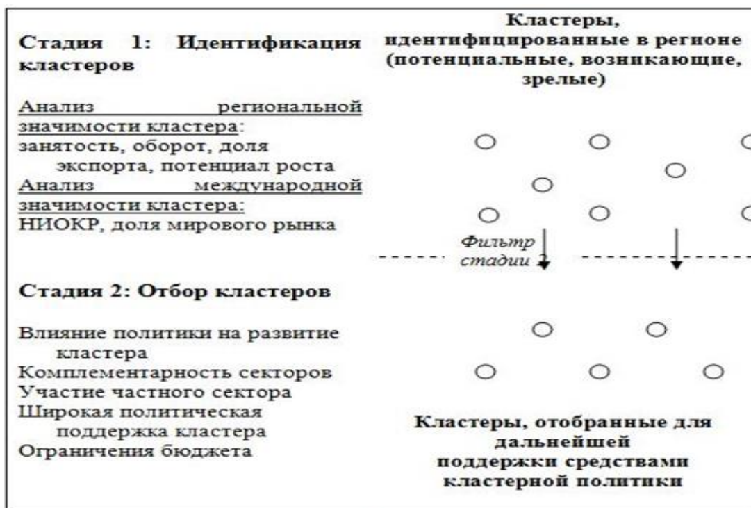
Рис. 1. Стадии кластерного анализа

«Внешний» анализ осуществляется на второй ступени: посредством сравнительного анализа исследуется международная значимость кластера. Преимуществом этого типа анализа можно назвать возможность выявления роли некоммерческих образований в экономике, в частности исследовательских организаций.