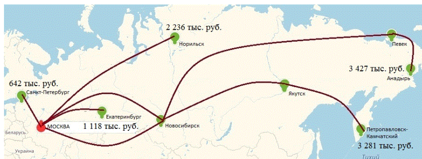
Рис. 2 Стоимости выполнения маршрутов с промежуточными посадками