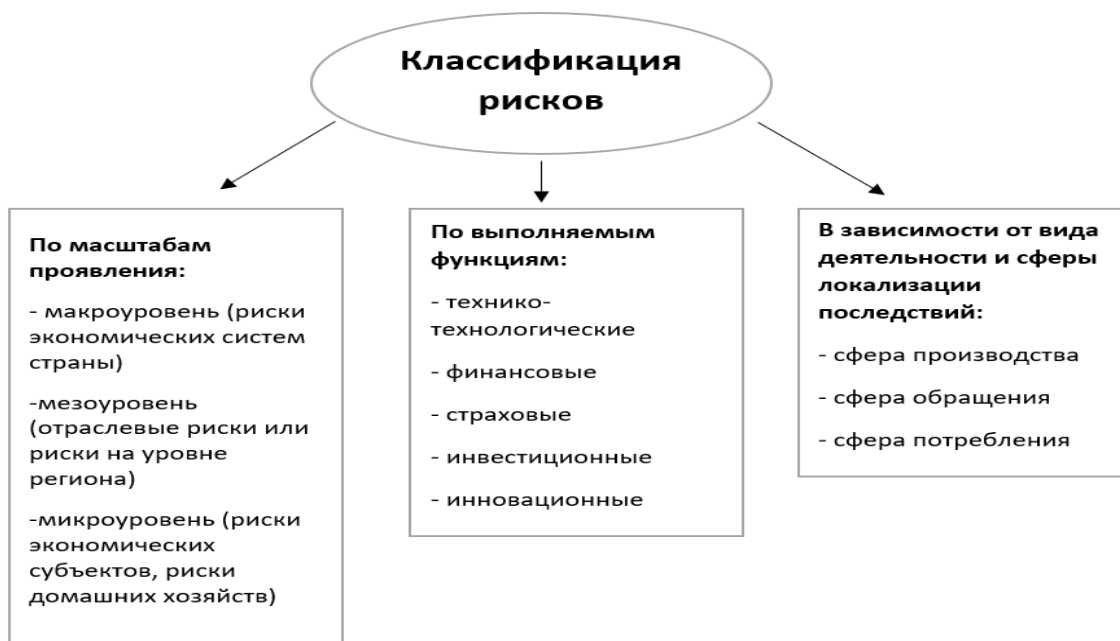
Рисунок 1 – Классификация рисков

Отечественные и зарубежные исследователи постигли тему рисков, их классификацию и влияние, оказывающее на уровень благосостояния. Классифицировать риски можно по следующим признакам (рисунок 1):