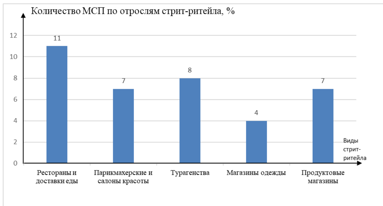
Рисунок 2 – Показатели МСП по стрит-ритейлу в Самарском регионе

На рисунке 2 приведены показатели Топ-5 самых популярных отраслей стрит-ритейла в Самарском регионе и количество предприятий МСП по ним.