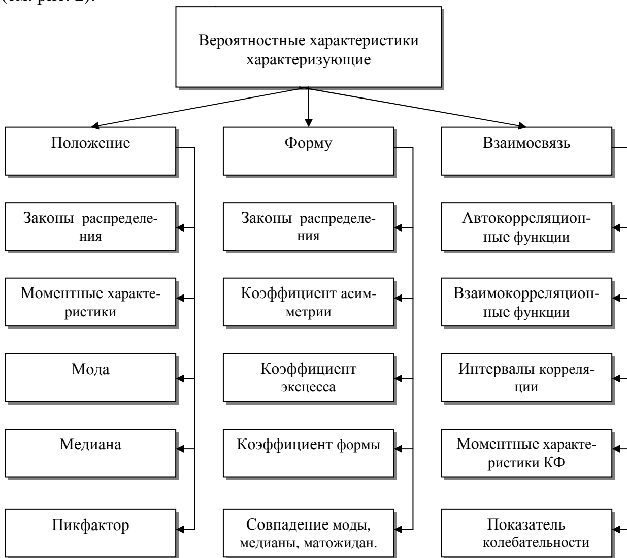
Рис. 2. Классификация вероятностных характеристик случайных процессов

Все вероятностные характеристики, определяемые во временной области, можно условно разделить на характеристики положения и формы кривой распределения вероятностей случайного процесса и характеристики взаимосвязи (см. рис. 2).