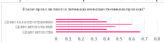
Рисунок 3 – Понимание содержания «личные неимущественные права»