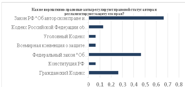
Рисунок 1 – Правовое регулирование статуса авторов музыкальных произведений