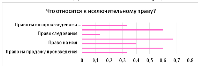
Рисунок 4 – Понимание содержания «исключительные права»