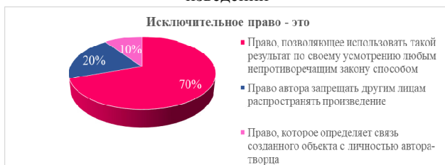
Рисунок 2 – Понимание термина «исключительное право»