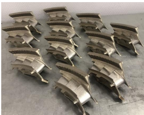
Рис. 1 – Заготовка секций СА

Изготовление заготовок секций соплового аппарата (СА) турбины, выращенных из металлического порошка (средний диаметр частиц составляет 15...53 мкм) жаропрочного сплава Inconel 738 производилось на установке SLM 280HL (рис. 1) [1]. Контроль секций СА турбины ГТД, изготовленной по аддитивной технологии производился на координатно-измерительной машине HERA 15.10.9.