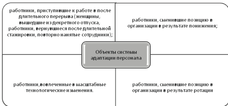
Рисунок 1 – Объекты системы адаптации персонала

Необходимость рассматривать все перечисленные выше категории персонала в качестве объектов управления адаптацией вытекает из понимания процесса адаптации сотрудника как процесса согласования целей, методов достижения целей и ценностей сотрудников и организации.