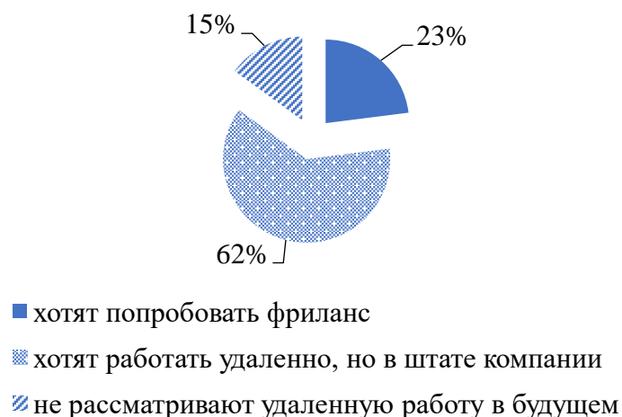
Рисунок 2 - Структура респондентов по опыту работы в удалённом формате, %

Основным преимуществом удаленной работы является возможность самостоятельно распределять свое рабочее время (таблица 1):