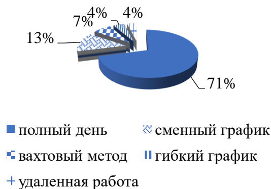
Рисунок 4 - Структура вакансий по графику работы, %

При этом число вакансий, изначально предполагающих исключительно удаленный формат работы, в сентябре выросло в полтора раза по сравнению с августом. Только в целом по стране таких предложений появилось почти 26 тысяч, что стало рекордом, сообщает рекрутинговый сервис HeadHunter. В октябре 2020 года число вакансий, предполагающих удаленный формат работы, выросло до 28 922 штук. [4]