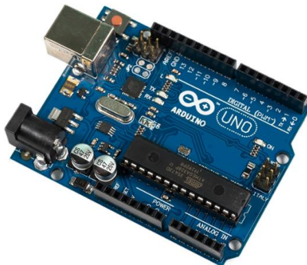
Рисунок 1 – Плата Arduino uno r3

На электронные блоки беспилотных летательных аппаратов воздействуют механические вибрации в диапазоне, как правило, от 50 до 500 Гц. Моделирование вибрационных воздействий позволяет избежать ошибок проектирования и аварийных ситуаций на стадии эксплуатации [1]. В качестве примера рассмотрена плата популярного микроконтроллера Arduino uno r3 (рис. 1).